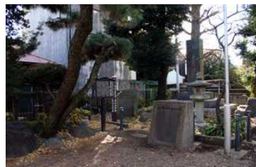
清水金左衛門本陣跡