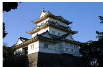
小田原城・天守閣