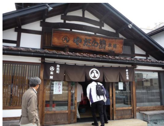
やたらジョッパイ