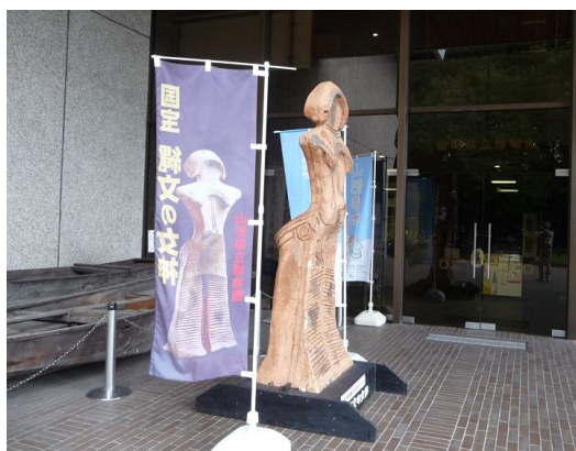
玄関では女神のレプリカがお出迎え